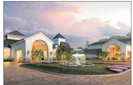
懷來皇冠假日酒店