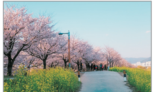
《增遊》釜山大渚生態公園(賞櫻花/油菜花註1) (3月30日至4月21日出發團隊適用)