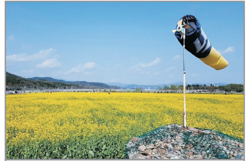
《增遊》尚州河中島(賞油菜花註1) (4月6日至19日出發團隊適用)