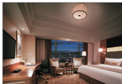
呼和浩特香格里拉酒店客房