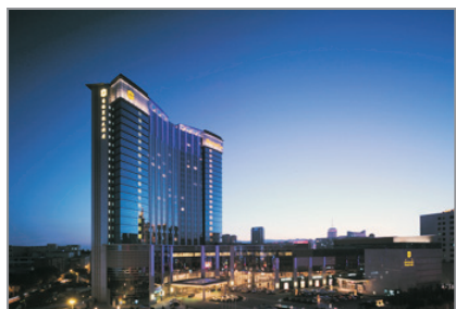
呼和浩特香格里拉酒店