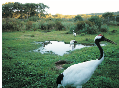
丹頂鶴自然生態公園(釧路)