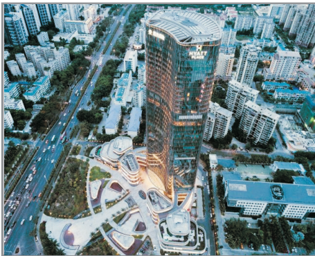
三亞中心凱悅嘉軒酒店

#寶亨荔苑溫泉酒店「荔瓊豪華溫泉房」原名為「山景獨立泡池客房」，房型及房內設施不變。如遇「荔瓊豪華溫泉房」房滿，將安排入住「荔瓊高級溫泉房」（房間均設獨立泡池）。