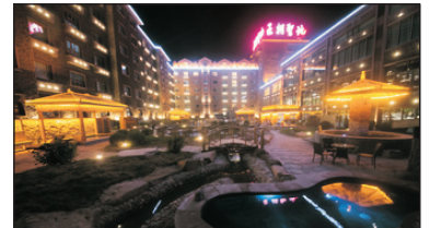
王朝聖地溫泉度假酒店