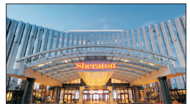
長春淨月潭益田喜來登酒店