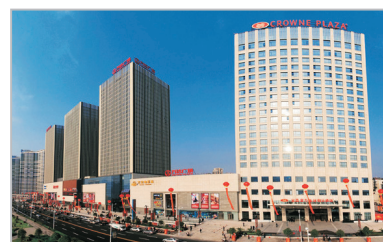
宜昌富力皇冠假日酒店