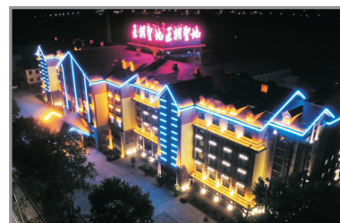
王朝聖地溫泉度假酒店