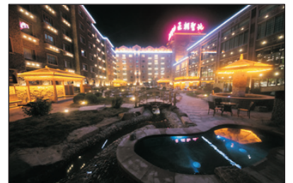
王朝聖地溫泉度假酒店