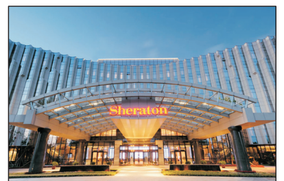
長春淨月潭益田喜來登酒店