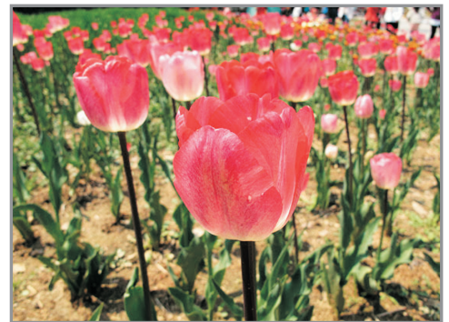
富川自然生態公園