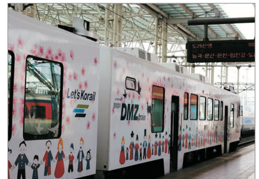
DMZ-train和平列車觀光之旅