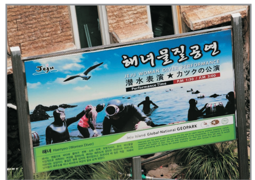
海女海撈潛水表演