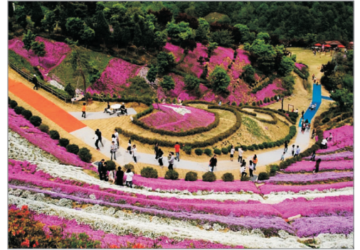
鎮安元延章芝櫻慶典