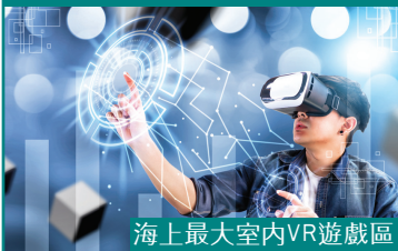
海上最大室內VR遊戲區

排水量：151,300噸 層數：18層 客房數量：1686間 船上員工：1999人 載客量：3376人 網址： www.dreamcruiseline.com