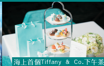
海上首個Tiffany & Co.下午茶