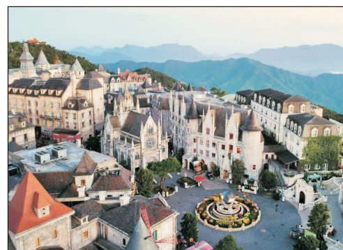
巴拿山旅遊度假區

• 巴拿山被譽為越南境內的最理想的度假勝地，那裡有一大片的歐式建築。區內景點包括打卡熱點「黃金巨手托橋」、法國村、愛情花園、越南首列登山火車、古酒窖、亞洲最大的室內遊樂場~Fantasy Park 娛樂城、蠟像館及纜車系統等。(包乘坐列入健力士世界紀錄，單線索道長達5042米的纜車往返。)