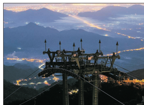
巴拿山旅遊度假區