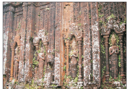
美山聖地遺址建築群

峴港—早上悠閒享用酒店設施(約11:00出發)—「世界文化遺產」美山聖地遺址建築群(包入場)—夜遊會安古城(包昂貴入費)—來遠橋(日本橋)—中華五邦古老會館