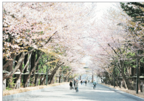
《特別增遊》「賞櫻名所」北海道神宮 (5月1-10日出發適用)(註2)