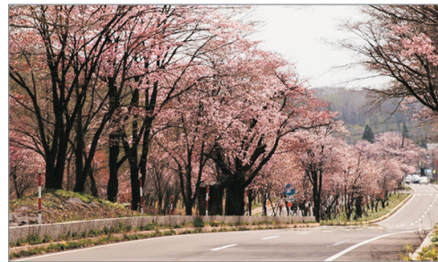
《增遊》登別櫻並木道 (5月11-20日出發適用)(註2)