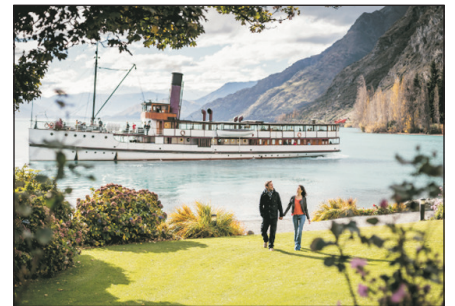
厄恩斯勞號百年蒸汽船