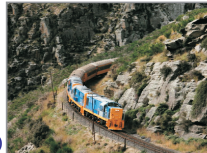
泰瑞峽谷觀光火車

Auckland, Rotorua, Queenstown, Dunedin, Mount Cook 9 Days