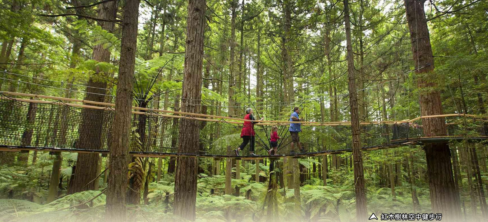
▲ 紅木樹林空中健步行