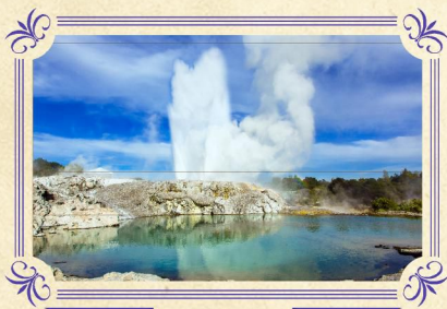
蒂普瓦毛利文化及地熱保護區

▶ 乘坐登山纜車到達600米高的博士峰山頂，於被選為世界最佳景觀的餐廳一邊享用自助午餐，一邊飽覽有「世外桃源」美譽之稱的皇后鎮湖光山色美景。