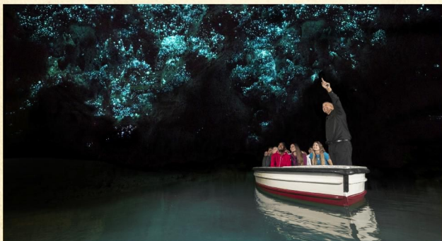
▲ 懷托摩鐘乳石及螢火蟲洞

Rotorua▶Te Puia▶Deer Shop▶Waitomo Glow Worm Cave▶Auckland