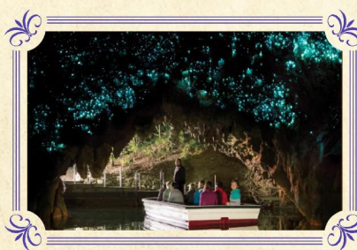
懷托摩鐘乳石及螢火蟲洞

▶ 蒂普瓦毛利文化及地熱保護區坐落於羅托魯亞城市的邊緣，佔地面積達70公頃，蒂普瓦擁有舉世聞名的間歇噴泉、地熱溫泉、矽質岩層等，遊客亦可在這裡親身深入了解新西蘭原住民～毛利族人的悠久歷史、傳統文化及習俗。