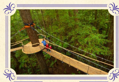
紅木樹林空中健步行 (包門票)

▶ 參觀形狀千奇百怪的石灰岩鐘乳石洞，然後乘坐小遊覽船摸黑在螢光蟲洞內漫遊，欣賞著名藍色螢火蟲，點點蟲光恍如黑夜中閃爍的繁星，難忘體驗。