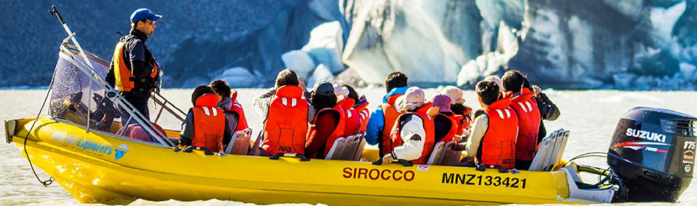
▲ 塔斯曼冰河船之旅