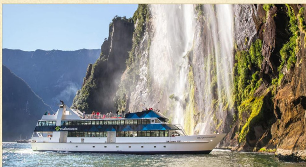
▲ 美福灣大自然之旅(自費參加)

• 皇后鎮: 座落在新西蘭第三大湖畔瓦卡蒂普湖岸邊, 背靠卓越山脈, 四周環山, 風光如畫。因地理環境關係, 各式各樣刺激活動盡在此。這個小鎮亦是通往風光冠絕新西蘭的美福灣重要關口, 可選乘觀光巴士或飛機前往, 湖光山色美不勝收。