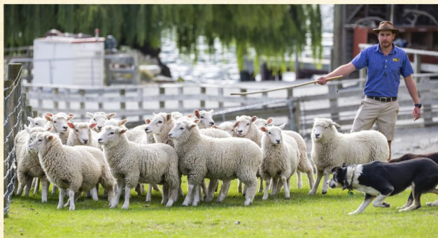
▲ 瓦爾特峰高原牧場

Queenstown▶TSS Earnslaw Cruises▶Farm Show▶Afternoon Free For Leisure▶Queenstown