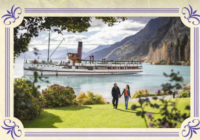
厄恩斯勞號百年蒸汽船

▶ 專業導賞員帶領您使用專業的天文望遠鏡觀賞迷人的銀河系及探索壯麗南部天空的不同元素，並由華籍專業導賞員為您解說天文知識，以雷射光導引觀賞。貴賓更可透過不同類型的天文望遠鏡觀看燦爛的星空，美麗得令人感動。