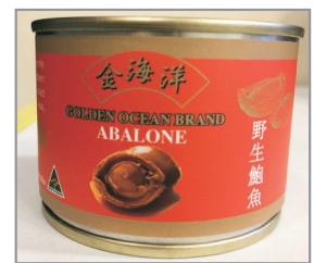
每位成人貴賓 均可獲贈一罐即食鮑魚(備註19)