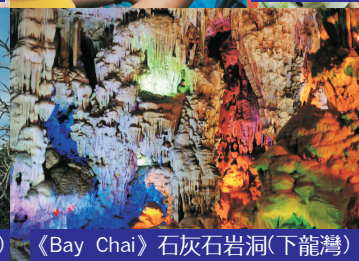
《Bay Chai》石灰石岩洞(下龍灣)