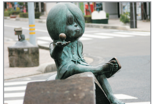
鬼太郎之鄉水木茂大道