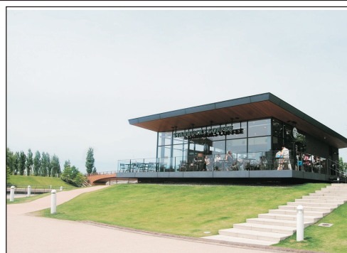
富山環水公園「世上最美星巴克」