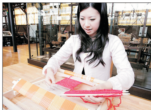
機屋紀念館(織布機杯墊DIY)