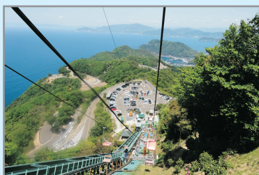
梅丈岳山頂自然公園