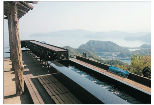
梅丈岳山頂自然公園