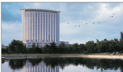
包頭香格里拉酒店外觀