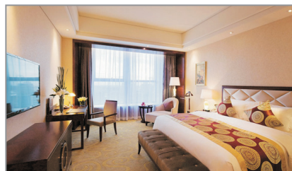
鄂爾多斯博源豪生酒店客房