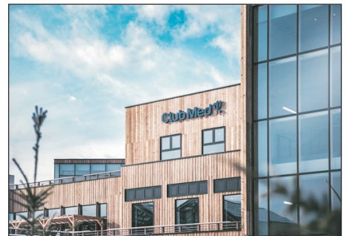
Tomamu Club Med溫泉度假村