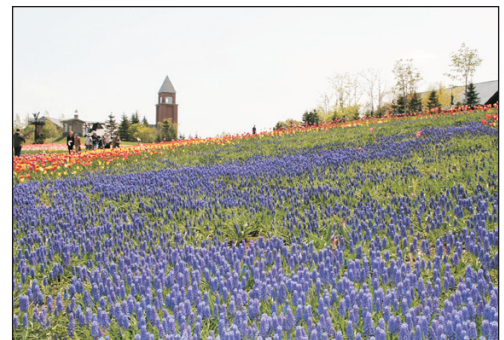
國營瀧野鈴蘭丘陵公園