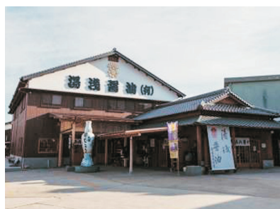
湯淺醬油館(和歌山)

以吉野熊野國立公園的鬼城為背景，將點燃約1萬枚煙花，從兩艘全速前進的船上點燃的煙花，一個接一個地綻放在海上，在水面上呈現出半圓形的花朵。還有另一大亮點是在岩壁上施放的煙火，稱作「鬼城大煙火」。