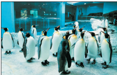
長崎企鵝水族館(日本·長崎)