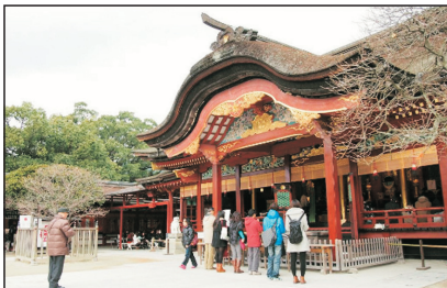
太宰府天滿宮(博多，日本)