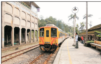
菁桐火車站(台北，台灣)