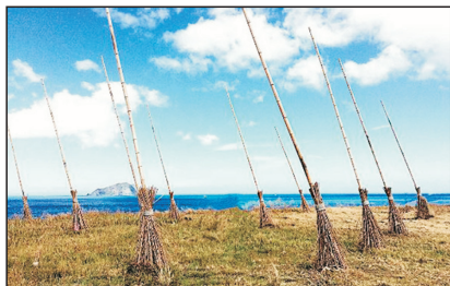
潮境公園(台北，台灣)