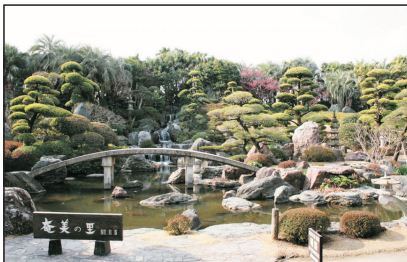
奄美之里(鹿兒島，日本)