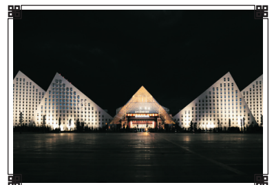
聖地天堂洲際大飯店