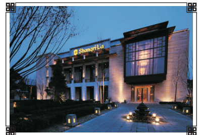
拉薩香格里拉大酒店