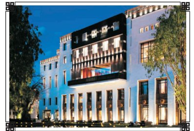
拉薩瑞吉度假酒店