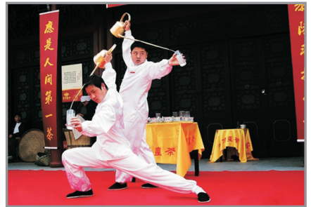
《龍行十八式》茶技表演