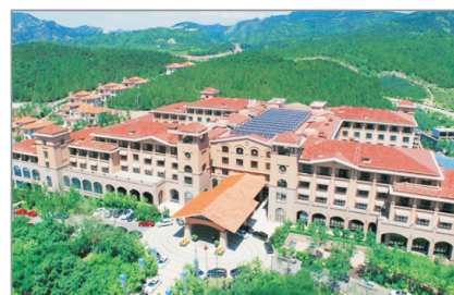
京薊聖光萬豪酒店

緊鄰薊縣府君山公園, 北望盤山, 遠觀翠屏湖, 綠色景致, 簇擁眼簾。作為低碳主題酒店, 應用了多項環保概念, 又配備了碳排放標識系統, 紀錄了每位住客的「碳足跡」。酒店設有健身中心、泳池等設施。