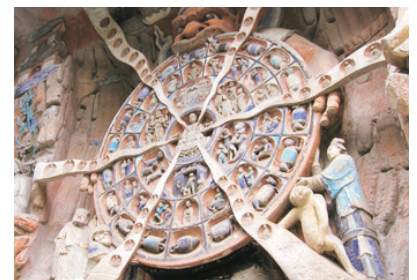
大足石刻~六道輪回圖

~鄂都鬼城：又稱為「幽都」，距今已有兩千多年的歷史，悠久的鬼文化，可說起源自東漢有陰、王二姓的道士在此修練。鬼城以各種陰曹地府的建築和造型而著名。鬼城內有哼哈祠、天子殿、奈河橋等多座表現陰間的建築。