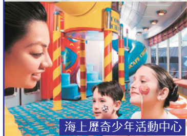
海上歷奇少年活動中心