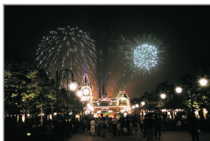
上海迪士尼樂園煙花