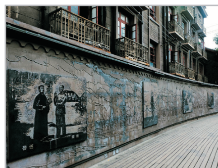
多倫路文化名人街