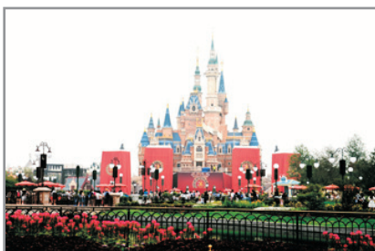
上海迪士尼樂園城堡