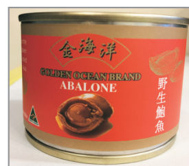
每位成人貴賓 均可獲贈一罐即食鮑魚(備註19)