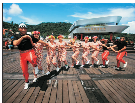
德化社部落(伊達邵)