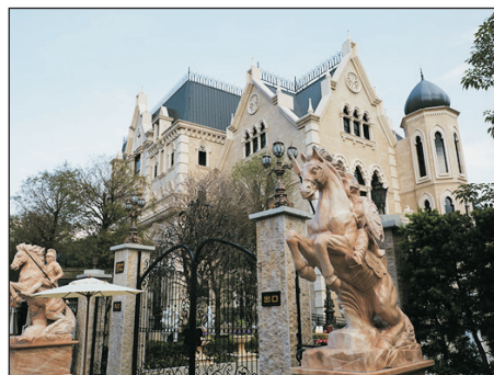
妮娜巧克力夢想城堡