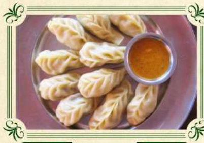
親嚐不丹風味地道菜式

不丹國家規定國民在上班上學、入廟拜神等正式場合都需穿著傳統服飾。男的會穿幘(Gho)，女的會穿旗拉(Kira)。特別安排團友試穿不丹國服，體驗不丹獨特的衣著文化，穿起來就像不丹的國王與皇后一樣大方優雅，亦暫作一個不丹人。