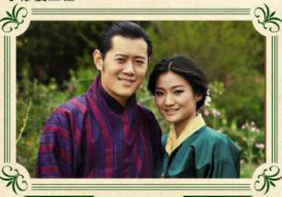
穿著傳統服飾，做個不丹人!

建於1657年，座落於波河(父親河)和莫河(母親河)的交匯處，號稱是不丹最美麗的寺廟，亦是不丹國王加冕及舉辦大婚之地，所以亦有「幸福皇宮」之美譽。