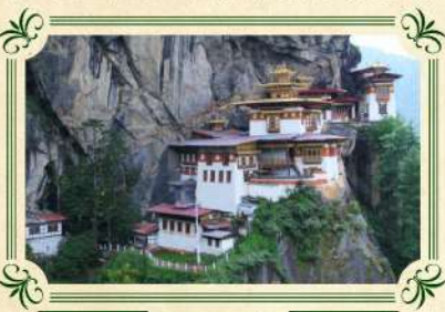
「世界十大寺廟」虎穴寺

不丹被譽為「全世界最快樂的國度之一」，根據統計，不丹國民生活的快樂指數高達97%，但這種快樂並不是來自外在物質的慾望滿足，而是來自於信仰與觀念的知足，加上不丹風景怡人，令當地人民培育出樂天知命，與世無爭的性格。不丹前國王吉莫·辛吉·旺楚克提倡不以經濟發展為優先，以建立一個快樂、平等、關懷與環境保護為理念的國家，「快樂國度」並不只是一個稱號，而是真正存在。