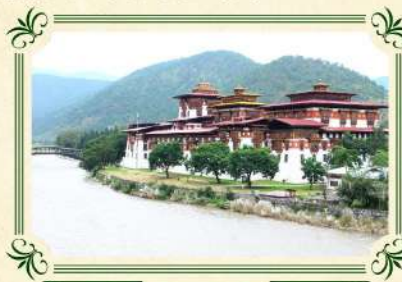
「最快樂的皇宮」普納卡宗

建於海拔3100公尺的高山峭壁之上，氣於2015年建成，約高169尺(約52米)，是全世界最大的釋迦牟尼佛像之一，而內部還有十萬多尊的小佛像。旅客站在附近的觀景台，更可飽覽整個廷布山谷的全景。