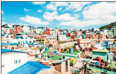
甘川洞文化村(釜山，韓國)