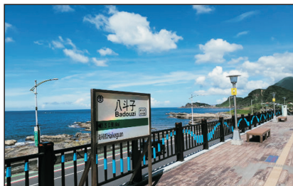
八斗子車站(台北，台灣)