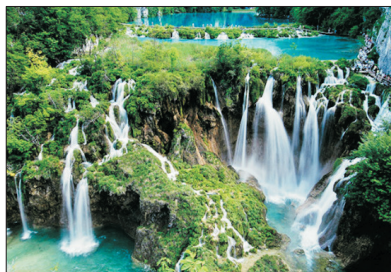
「世界文化遺產」 十六湖國家公園

這是克羅地亞最大的城市，是一個擁有深厚文化根基及處處呈現中歐與東歐傳統特色的魅力城市。