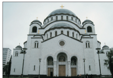
「世上最大東正教堂」 聖莎瓦教堂

有「歐洲九寨溝」美譽，湖水顏色蔚藍、彩綠，變化萬千，大大小小的美麗湖泊，加上茂密森林、清澈河流、秀麗瀑布，整個公園猶如一幅令人心動的山水名畫。