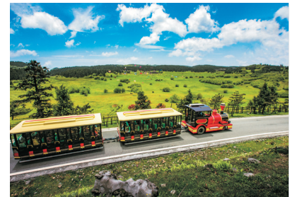
仙女山國家森林公園

Day 4 船上自由活動—忠縣(登岸參觀)—石寶寨*(世界八大奇異建築)(遊覽時間約2小時)—船員歡迎晚會 * 如因天氣變化而引至長江水位變動，石寶寨之行程將更改為其他景點，此安排視乎當時情況而定，不作另行通知。