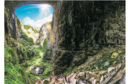
武隆景區~天生三橋

Day 3 武隆—仙女山國家森林公園(包觀光小火車)(遊覽時間約2小時)—【土雞風味】—重慶—洪崖洞吊腳樓(遊覽時間約1小時)—【重慶鴛鴦火鍋風味】—重慶碼頭登船(註3)—長江三峽之旅 ~仙女山國家森林公園：國家5A級景區，是重慶周邊最大的高山草原，以其江南獨具魅力的高山草原、南國罕見的林海雪原、青幽秀美的叢林碧野景觀而譽為「東方瑞士」。仙女山的林海、奇峰、草場、雪原被遊客稱為四絕。 ~洪崖洞吊腳樓：以川東特色的吊腳樓、穿門房、戲臺和戲院為主要建築，展示了巴渝街區的傳統民俗風貌，集合了吃、喝、玩、樂所有元素，有一條長達百餘公尺的天井街及一條食堂林立的美食街。洪崖洞吊腳樓依山就勢，沿江而建，落差達75米，古色古香。 *武隆至重慶，車程約3小時。