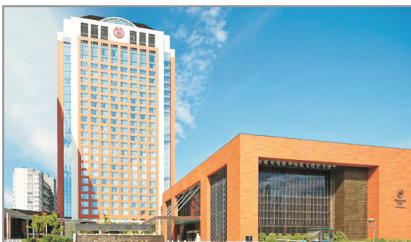
呼和浩特喜來登酒店外觀