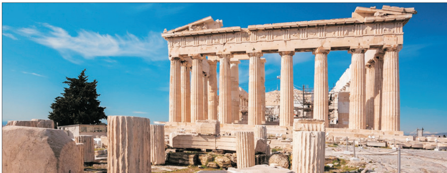
卡塔科隆(希臘) Page 2