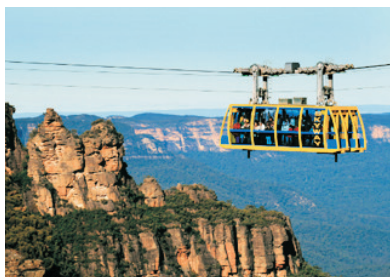
世界自然遺產~藍山國家公園