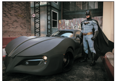
蝙蝠俠(華納電影城)

Day 6 布里斯本機場→香港 Brisbane Airport→Hong Kong