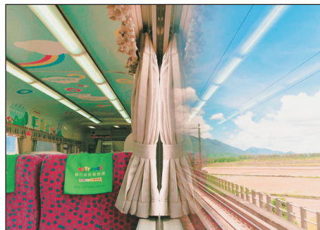
環島之星觀光列車