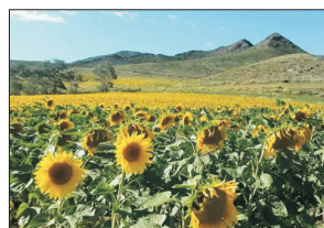
黃崗梁國家森林公園

以獨具特色的森林、草原景觀與蒙古族民俗風情為主體，內有阿斯哈圖石林、原始十萬畝松海、石峰天然白樺、濕地千畝樟子等風景。黃崗梁地區保存了第四紀冰川最完整的形態，且類型多樣，是典型的山谷冰川。登上觀景台，放眼望去，一片山高林密，是塞北地區罕見的天然森林群落。特別安排前往經歷億萬年冰河世紀雕琢的阿斯哈圖石林，您將會被它形態萬千、造型各異的景色所震撼。