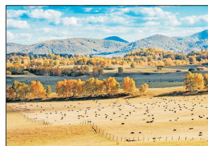
烏蘭布統壩上草原

烏蘭布統草原位於內蒙古赤峰壩上，海拔平均1500米，屬丘陵與平原交錯，森林和草原結合的地帶。烏蘭布統曾是清朝木蘭圍場的一部分，也是軍馬的養育訓練基地，因康熙皇帝指揮清軍大戰噶爾丹而聞名；其迷人的草原風光更成為中外聞名的影視基地。由於區內長滿密茂的白樺林，是夏秋兩季的著名攝影勝地。特別安排乘坐越野車遊覽，參觀夾皮溝、野鴨湖、大小峽谷、五彩山、北溝、影視基地。