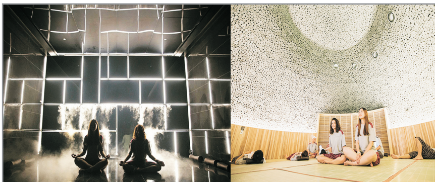
高陽/河南Starfield Shopping Mall~Aquafield Jjimjil SPA

Aquafield Jjimjil熱療是以「休息與療癒」為重點而打造的三溫暖汗蒸幕, 其內部空間根據具體功能被劃分, 奢華的內部設計、9個獨特的主題區特色汗蒸幕, 贏得外國遊客的好口碑。特別推介: 用水蒸氣打造出的雲端熱療室、能够觀賞360度全景影像的多媒體藝術熱療室、充滿自然氣息的扁柏木熱療室、有美容幫助的鹽磚熱療室、讓人快樂且盡情流汗的木炭房及戶外FOOT SPA。