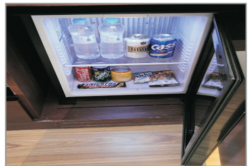
【慶源齋】客房內無料Minibar