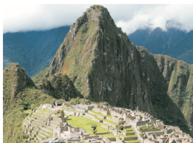
「世界文化遺產」天空之城