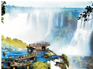
海陸空探索伊瓜蘇瀑布