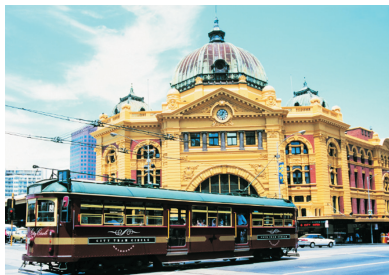
福林德街百年火車站