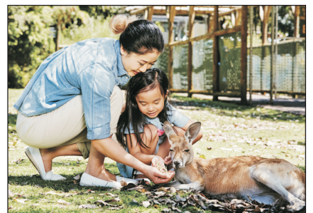
卡弗沙姆野生動物園

Perth-Morning Free for Leisure-Caversham Wildlife Park-Swan Valley-Morish Nuts-Honey Shop-Chocolate Factory-Westfield Shopping Mall-Perth Airport